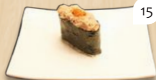
Ura gunkan tonijnsalade