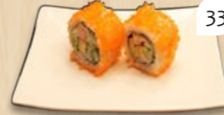
California inside-out crabstick avocado