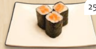
Sake maki zalm