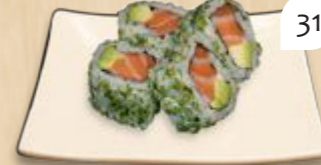
Sake avocado inside-out zalm avocado (2 st.)