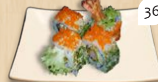
Kushi inside-out gefrituurde garnaal