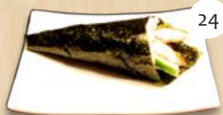
Unagi temaki paling