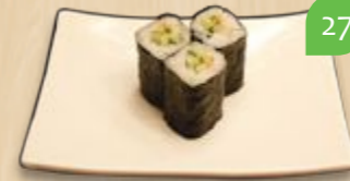
Kappa maki komkommer