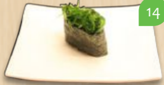
Wakama gunkan zeewier