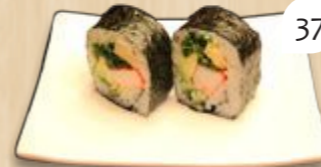
Futo maki Japanse vulling (crabstick, avocado, zeewier en omelet)