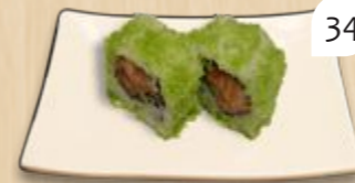
Wasabi masago inside-out