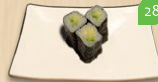
Avocado maki avocado