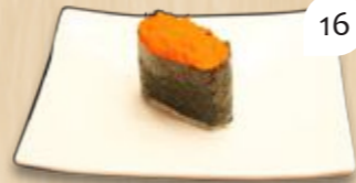
Masago gunkan viskuit