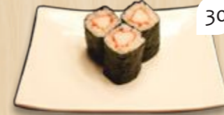
Kani maki crabstick