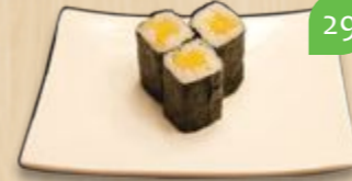
Oshika maki rettich