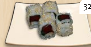
Spicy tuna inside-out pittige tonijn (2 st.)