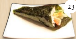
California temaki crabstick