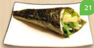
Yasai temaki vegetarisch