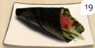
Maguro temaki tonijn