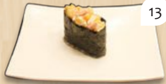
Corn gunkan mais