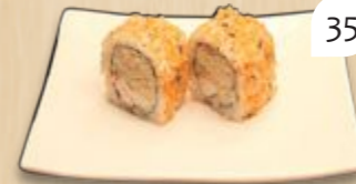
Ura inside-out gekookte tonijn salade