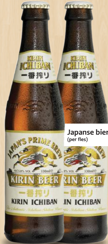
Japanse bier Kirin € 3,80 (per fles)