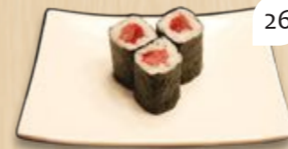
Tekka maki tonijn