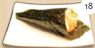
Sake temaki zalm