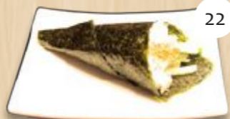
Ura temaki tonijnsalade