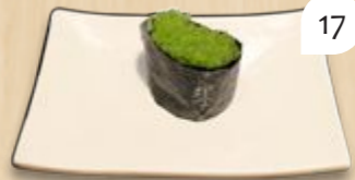
Wasabi masago gunkan